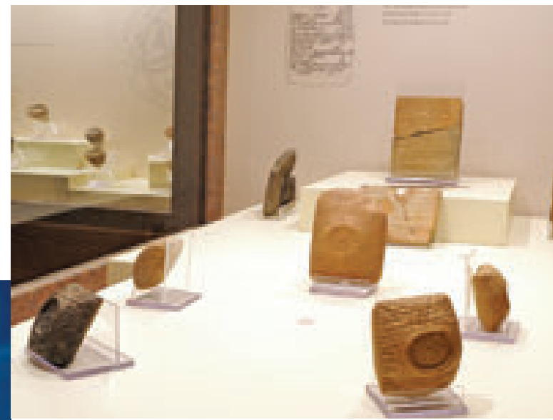
Hitit Dönemi Tabletler Tablets Hittite period

A chronological exhibition beginning from Chalcolithic Age found in Alacahöyük and Kuşsaray exhibitions is realized in Archaeology Hall. This is followed by the display windows in which Old Bronze Age Resuloğlu Graveyard Excavation findings and Alacahöyük excavation findings are being displayed. The burial ceremony pertaining to the Old Bronze Age Alacahöyük tomb which is being displayed in accordance with its original form is animated virtually. The visitors are able to obtain information interactively by touching the screen.